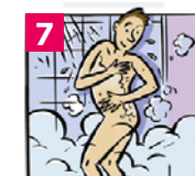
7 Rincer abondamment du haut vers le bas