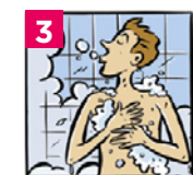
3 Appliquer le savon en commençant par les cheveux et faire mousser