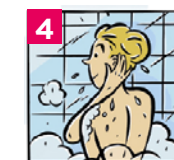
4 Laver ensuite le visage et le cou en insistant derrière les oreilles