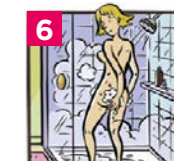
6 Savonner en dernier la région génitale puis la région anale