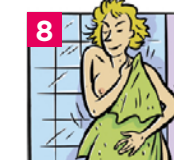
8 Se sécher avec une serviette propre et revêtir une tenue propre

Renouveler les étapes 3 à 7 une seconde fois en respectant la même méthode.