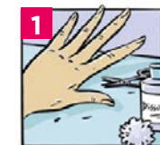
1 Enlever le vernis, couper et nettoyer les ongles des mains et des pieds