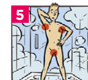
5 Insister sur les aisselles, le nombril, les plis de l'aine et les pieds