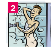
2 Mouiller le corps et les cheveux du haut vers le bas